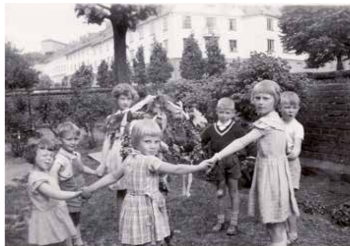
Dans kring midsommarstången på daghemmets gård 1954 eller 1955.

Vi slängde allt vårt avfall i en gul emaljerad slaskhink. Det var min brors och min uppgift att gå ner till soprummet och tömma den. Vi bråkade ofta om vems tur det var. Som lite äldre kom min bror på att han kunde betala mig i stället för att gå ner själv. Det gick jag med på eftersom jag gärna sparade på pengar.