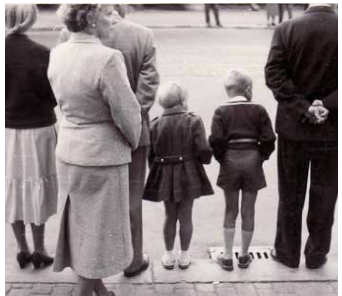
I spänd väntan på Chalmerskortegen 1954.

Jag hjälpte gärna mamma med tvätten. I husets tvättstuga i källaren fanns det två stora tvättmaskiner där vattnet reglerades manuellt. I de stora bykkaren av plåt lades tvätten i blöt. Mamma och jag drog lakan, vek ihop och manglade dem i den stora tunga golv-mangeln. Jag tänker på det när jag manglar på vår elektriska lilla bänkmangel.