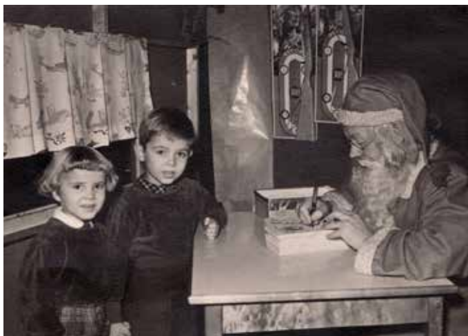
Brorsan och jag besöker tomten i varuhuset Grand Bazar på Kungsgatan 1953.

Luxemburg, med de senaste poplåtarna. Min skolväg var en stig som gick parallellt med sandtaget. Den var särskilt vacker på höstarna när alla rönnbärsträden lyste röda. Vid ena ändan av Landerigatan tog jag mig ner för sandtaget där det var som lägst, och fortsatte sedan via Uddevallagatan till Ånässkolan på Falkgatan. I några år gick jag på Bagaregårdsskolan. Jag fick vara kvar på daghemmet ett år efter att jag börjat skolan, något fritids fanns inte. Sedan fick jag egen nyckel.