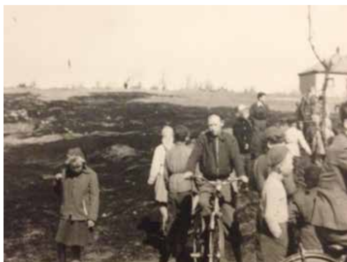
Nästan varje vår luntade buskillarna på ängen mellan Kobergsgatan och Nordåsgatan. Årtal okänt.

Hönökaksbageriet i Olskroken förgyllde också tillvaron för oss barn. Jag kan fortfarande minnas mjöldoftan i den lilla lokalen och doften av de alldeles nybakade delikatesserna. För några ören fick vi en påse med brödbitar. Kandisocker och lakritsrot var annat godis jag köpte då och då.