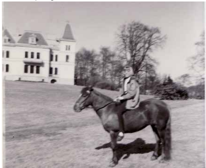
Jag på ponnyn Golden Girl, som jag skötte i flera år. I bakgrunden Stora Torps slott.

Brorsan tog båten till England i mitten på 60-talet och kom tillbaka med urfräcka kläder. Storprickig skjorta med runda kragsnibbar, blå, glansig syntet-tjacka och andra poppiga kläder. Han gjorde stor lycka bland tjejerna på den klubb i Nordstan han hade ihop med några kompisar, och förstås på andra popklubbar som fanns i Göteborg då: Cue Club, Vita Duvan, Dojan, med flera. De första ställena jag gick på var Östra reals skoldanser, High school club på Övre Majorsgatan och Jazzhuset.