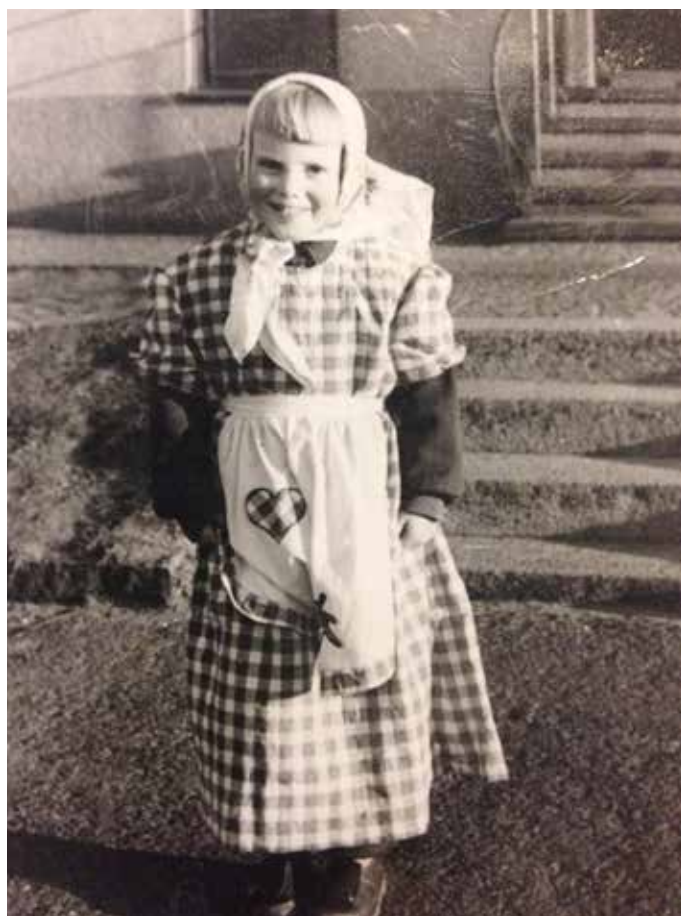
Jag som påskkäring på Nordåsgatan. Troligtvis 1954.

tv-kanal då. Vi lyssnade på Karusellen på radion i början på 50-talet och även på Frukostklubben . "Go morron, go morron, hör alla fåglar sjunga glatt..." Jo, den sitter i ännu, signaturmelodin.